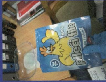
Uzorak 2 - Korak 2 Slika kupljenog zamrznutog proizvoda