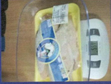
Uzorak 5 - Korak 2 Mjerenje kupljenog upakovanog proizvoda