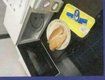
Uzorak 5 - Korak 4-1 Slika prije odmrzavanja u mikrotalasnoj peci