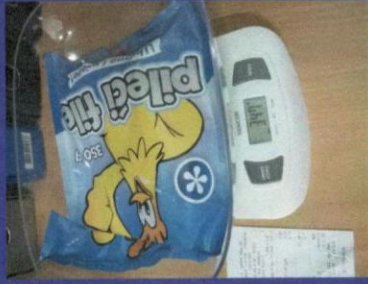
Uzorak 2 - Korak 2 Mjerenje kupljenog upakovanog proizvoda