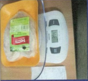
Uzorak 4 - Korak 2 Mjerenje kupljenog upakovanog proizvoda