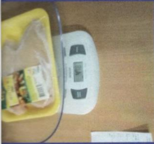
Uzorak 1 - Korak 2 Mjerenje kupljenog upakovanog proizvoda