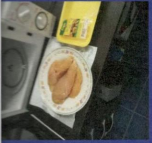
Uzorak 1 - Korak 4-2 Slika nakon odmrzavanja u mikrotalasnoj peci