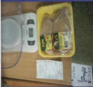
Uzorak 1 - Korak 2 Slika kupljenog zamrznutog proizvoda