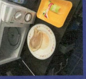
Uzorak 4 - Korak 4-2 Slika nakon odmrzavanja u mikrotalasnoj peci