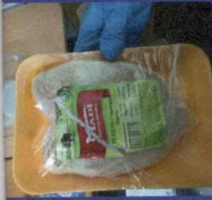
Uzorak 4 - Korak 2 Slika kupljenog zamrznutog proizvoda