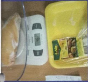
Uzorak 1 - Korak 3 Mjerenje otpakovanog zamrznutog proizvoda