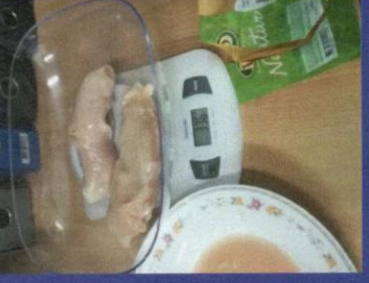
Uzorak 3 - Korak 4-3 Slika mjerenja nakon odmrzavanja proizvoda u mikrotalasnoj peci