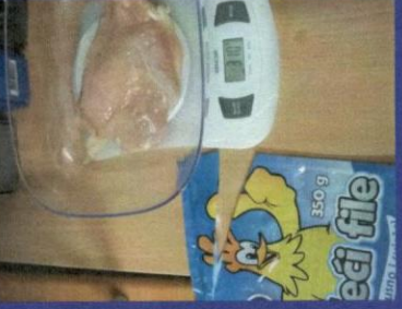
Uzorak 2 - Korak 4-3 Slika mjerenja nakon odmrzavanja proizvoda u mikrotalasnoj peci