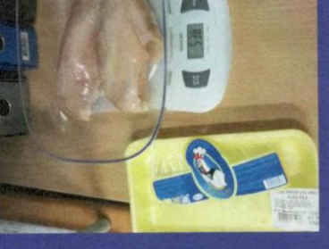
Uzorak 5 - Korak 4-3 Slika mjerenja nakon odmrzavanja proizvoda u mikrotalasnoj peci