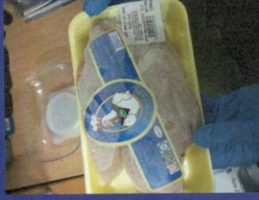
Uzorak 5 - Korak 2 Slika kupljenog zamrznutog proizvoda