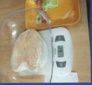
Uzorak 4 - Korak 3 Mjerenje otpakovanog zamrznutog proizvoda