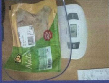
Uzorak 3 - Korak 2 Mjerenje kupljenog upakovanog proizvoda