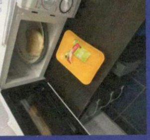
Uzorak 4 - Korak 4-1 Slika prije odmrzavanja u mikrotalasnoj peci