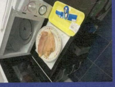
Uzorak 5 - Korak 4-2 Slika nakon odmrzavanja u mikrotalasnoj peci