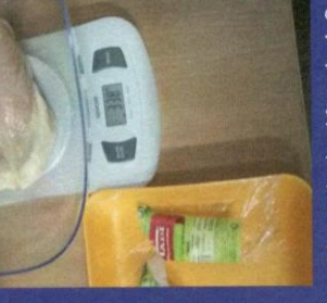
Uzorak 4 - Korak 4-3 Slika mjerenja nakon odmrzavanja proizvoda u mikrotalasnoj peci