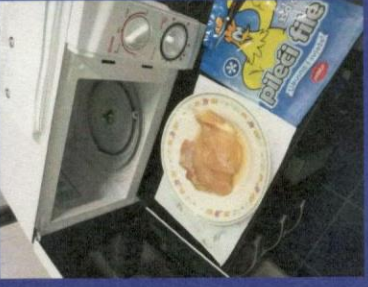
Uzorak 2 - Korak 4-2 Slika nakon odmrzavanja u mikrotalasnoj peci