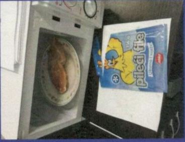
Uzorak 2 - Korak 4-1 Slika prije odmrzavanja u mikrotalasnoj peci