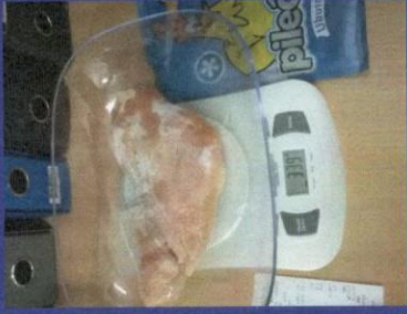
Uzorak 2 - Korak 3 Mjerenje otpakovanog zamrznutog proizvoda