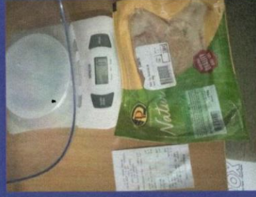
Uzorak 3 - Korak 2 Slika kupljenog zamrznutog proizvoda