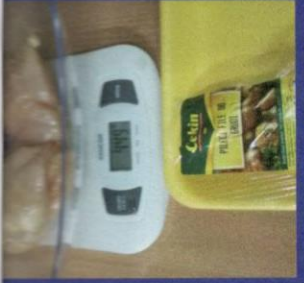
Uzorak 1 - Korak 4-3 Slika mjerenja nakon odmrzavanja proizvoda u mikrotalasnoj peci