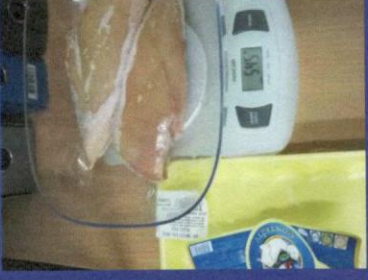
Uzorak 5 - Korak 3 Mjerenje otpakovanog zamrznutog proizvoda