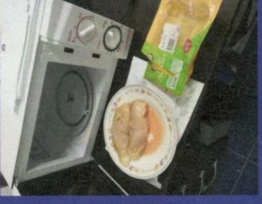
Uzorak 3 - Korak 4-2 Slika nakon odmrzavanja u mikrotalasnoj peci