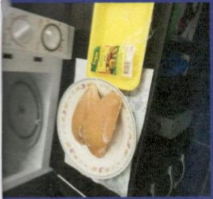
Uzorak 1 - Korak 4-1 Slika prije odmrzavanja u mikrotalasnoj peci