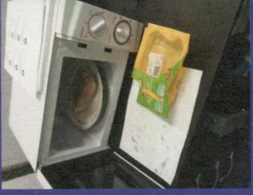
Uzorak 3 - Korak 4-1 Slika prije odmrzavanja u mikrotalasnoj peci